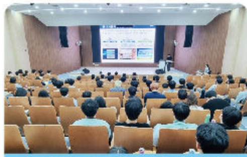
국내 성균관대 시화지구 현장학습