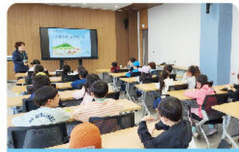
국내 시화호 환경학교 교육