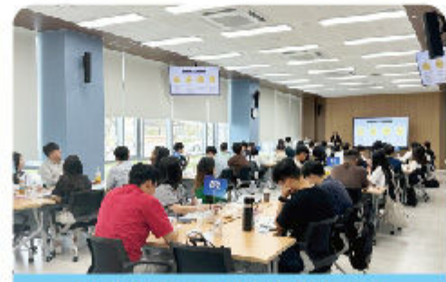
국내 K-water 신입대리 교육