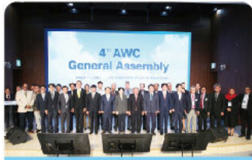
국외 AWC 4차 총회