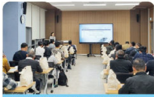
국외 인니 댐운영관리 역량강화