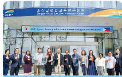
국외 필리핀 팜팡가강 초청연수